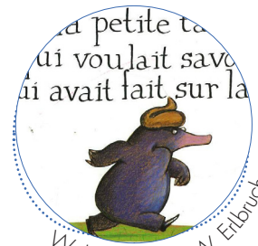
W. Holzwarth & W. Eilbruch